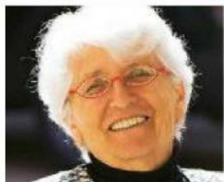
di Nicoletta Sipos