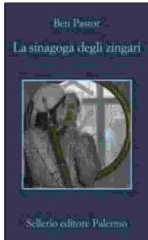
La copertina del libro Sellerio

piacere ai lettori il suo soldato nazista tramite il flusso di coscienza, che non dimentica il militare con i suoi doveri ma comprende anche i vari tormenti che attanagliano l'uomo costretto alla guerra.